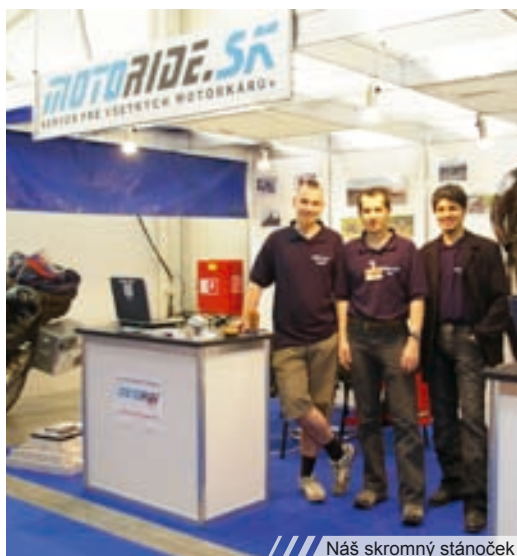
Náš skromný stánoček