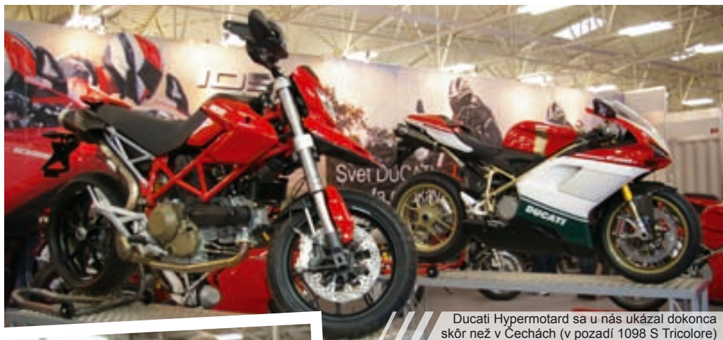
Ducati Hypermotard sa u nás ukázal dokonca skôr než v Čechách (v pozadí 1098 S Tricolore)