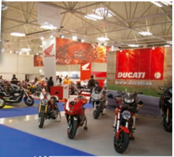
/// /// /// Výstava sa konečne dočkala väčších a krajších hál