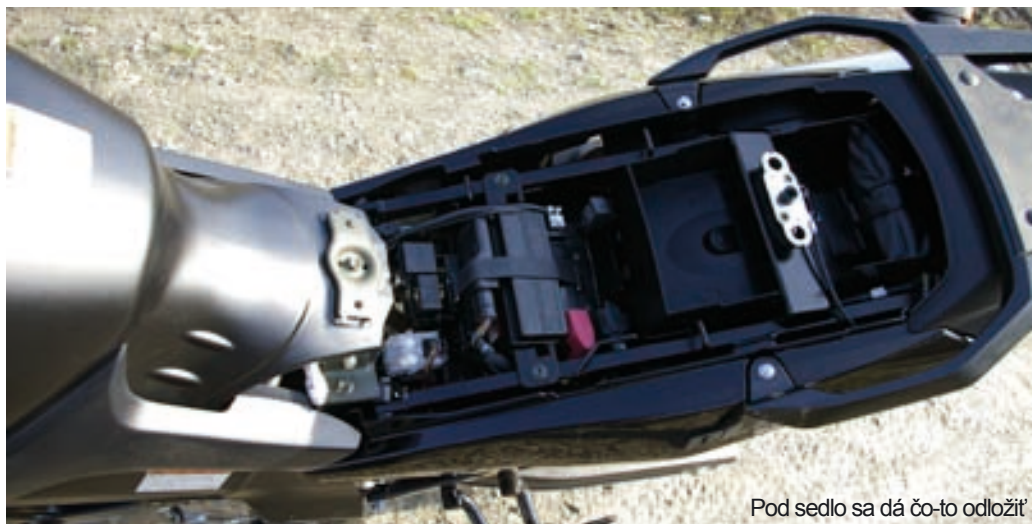
Pod sedlo sa dá čo-to odložiť

aktívnej bezpečnosti, netreba nič riešiť. Počas testu sa spotreba pohybovala od piatich do päť a pol litra (ale dá sa ísť aj za 4,4). Pri 22-litrovej nádrži, z ktorej rezerva tvorí asi štyri litre, to dáva priemerný dojazd 330 – 400 km, čo je trochu nadpriemer. Dojazd na rezervu je najprv indikovaný blikajúcou pumpičkou na displeji, ktorú si možno ani