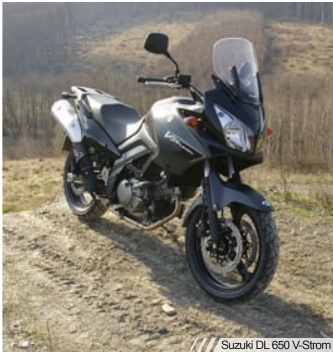
Suzuki DL 650 V-Strom