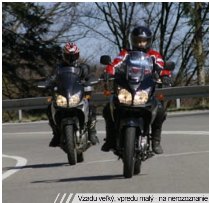
Vzadu veľký, vpredu malý - na nerozoznanie