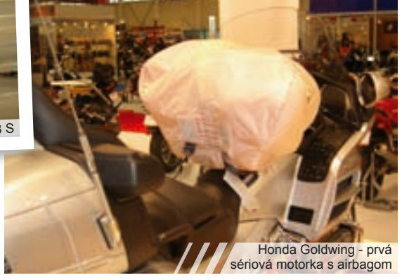
/// /// /// Honda Goldwing - prvá sériová motorka s airbagom