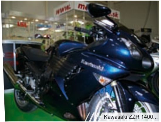
/// /// /// Kawasaki ZZR 1400...